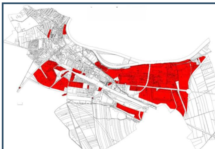
Průmyslové areály, kterých se změna daně nemovitosti týká

Zastupitelstvo již vyšší daň z nemovitosti pro průmysl a výrobu schválilo v roce 2023. Tehdy se nikdo neodvolával. V roce 2024 však došlo k úpravě zákona, který již neumožňoval tyto změny provádět pomocí vyhlášky, ale pouze skrze Opatření obecné povahy. "Je celkem zarážející, že Ministerstvo financí, které připravilo novelu k dani z nemovitosti rozesílalo skrze Finanční správu podklady, které mají obcím pomoc s postupem při vydávání Opatření obecné povahy.